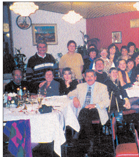
Momento di incontro con gli operatori dell'U.O. d

Infine un grazie agli operatori dell'Emato-Oncologia (niente nomi, tra medici, infermieri e OTA sarebbero troppi e poi mai come in questo caso il merito è del gruppo) che con impegno costruttivo e spirito di partecipazione hanno affrontato questa nuova attività.