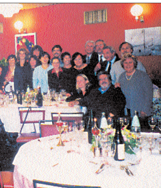
Emato-Oncologia Pediatrica del Burlo Garofolo.

L'obiettivo futuro è quello di proseguire, da un lato, nell'applicazione clinica di questa procedura che ci ha dato risultati molto incoraggianti nei pazienti trapiantati presso il nostro centro, e dall'altro, di incrementare l'attività di raccolta di sangue cordonale estendendola anche ad altri punti nascita della nostra Regione per aumentare il numero di piccoli pazienti che possano trarre beneficio da questa preziosa fonte di cellule staminali destinata, ancora troppo spesso, a finire nel cestino della spazzatura.