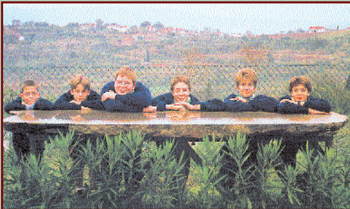
Questa è la squadriglia "PUMA": sembriamo docili, ma siamo delle belve!