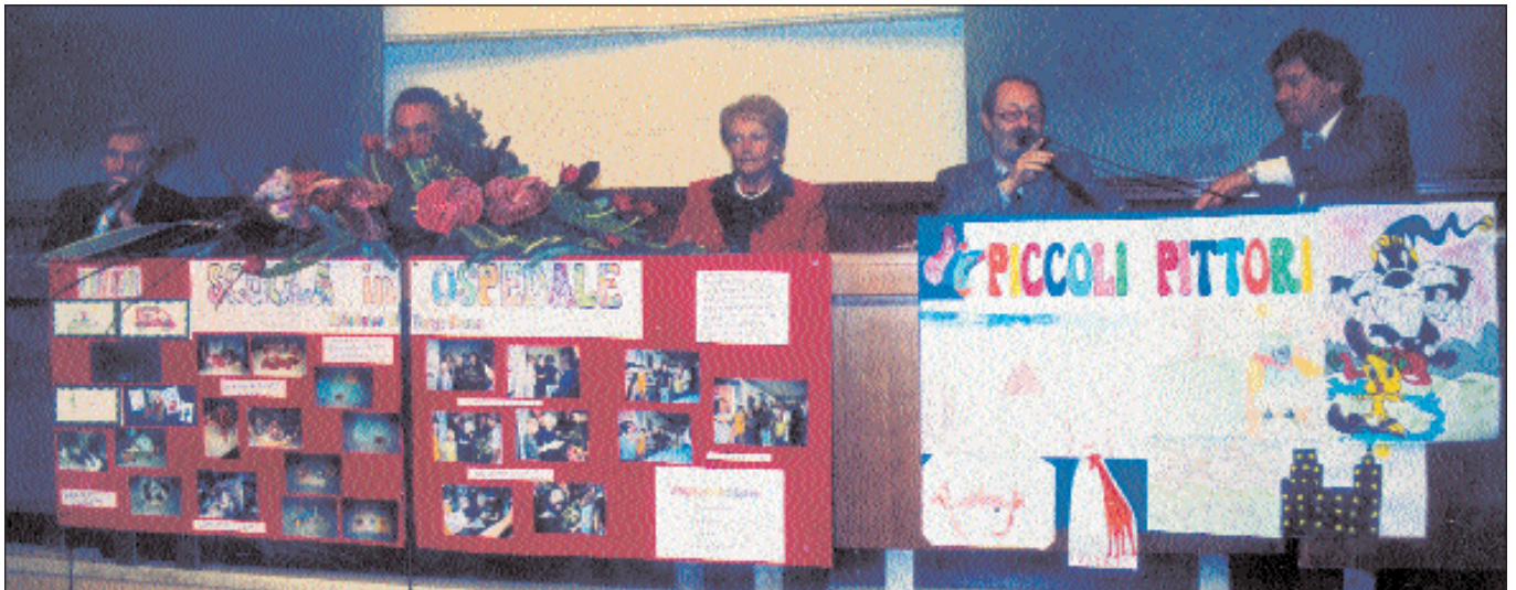
Un momento della giornata Fiagop tenutasi a Verona il 14 novembre scorso.

Ed è per questo che invito tutti i Genitori, i Soci ed oramai anche i nostri figli più grandi a partecipare il più possibile, nel prossimo anno, alle iniziative per il nostro ventennale, per ritrovare insieme quello slancio dei primi anni, per avere ancora una volta la forza di realizzare quanto ancora è necessario per vincere, per sempre, la nostra battaglia contro la malattia.