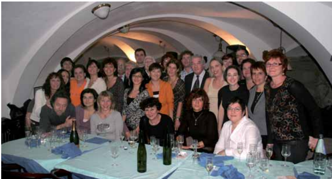
Una serata in allegria con tutto il personale

Lodevole iniziativa del Comitato Area Verde S. Andrea di Montebelluna che hanno deciso di scegliere la nostra Associazione quale beneficiaria dei profitti realizzati da varie manifestazioni da loro organizzate.