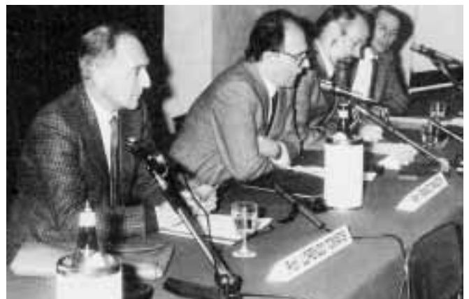
Serata medica del 1987