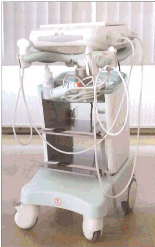
Ecografo portatile Ospedale Trieste