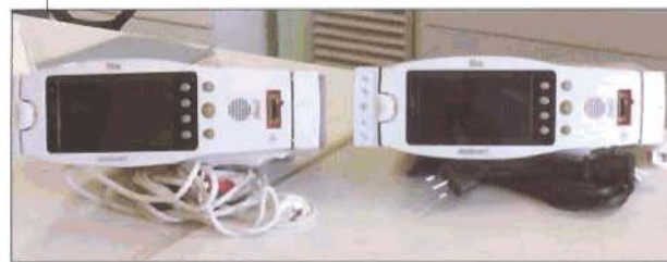
Pulsossimetri Ospedale Pordenone