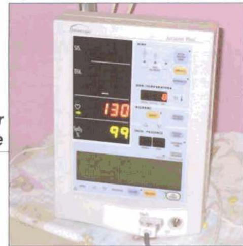
Monitor Ospedale Pordenone