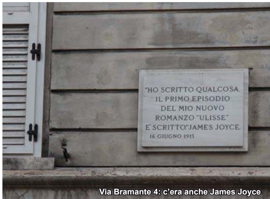
Via Bramante 4: c'era anche James Joyce

Questi amici si trovano in una città estranea e alle volte non sanno come muoversi. Al nostro ospedale viene data loro la migliore assistenza, anche dal punto di vista umano. Ma quando arrivano nella "Casa" bisogna accoglierli con tanta amicizia, il più delle volte non conoscono bene la nostra lingua. Devo ammettere che sono molto bravi ed imparano presto a farsi capire, pasticciando tra italiano, triestino, rumeno o che altro. Si arrangiano anche abbastanza bene con la cucina,