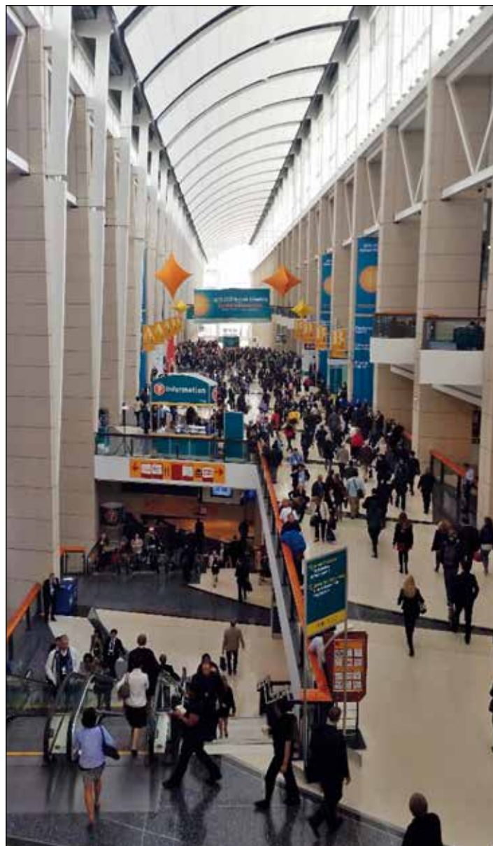
Una frazione del centro congressi decorato con i colori dell'ASCO

Complessivamente, l'ASCO è stato un congresso molto utile. In quattro giorni intensi è stato messo a punto lo stato dell'arte nella cura di diversi tipi di tumori infantili, si è parlato delle complicanze e dei problemi nella gestione dei nostri piccoli pazienti e ha sicuramente migliorato le mie conoscenze su svariati argomenti. Tra i vari argomenti trattati si è parlato molto dell'immunoterapia nei vari tipi di leucemie e tumori solidi, l'ultima arma letale nata, a disposizione contro le cellule tumorali, sicuramente promettente, riservata però a casi adeguatamente selezionati e che comunque si aggiunge ma non sostituisce la "comune" chemioterapia. Visto il (fortunatamente) sempre maggiore successo delle cure in oncologia pediatrica, il congresso ha dedicato molto spazio agli effetti a lungo termine della chemio e radioterapia, in particolare si è parlato molto dell'identificazione e della gestione delle possibili complicanze cerebrali, polmonari e cardiache delle cure alle quali vengono sottoposti i nostri piccoli pazienti, così come ampio spazio è stato dedicato al problema emergente dell'oncofertilità. Sono stati presentati i risultati preliminari dello studio congiunto europeo-americano sull'uso del dasatinib nel trattamento della leucemia linfoblastica acuta Philadelphia positiva (al quale anche il Burlo ha preso parte) e diversi studi riguardanti schemi terapeutici di terza o quarta linea per