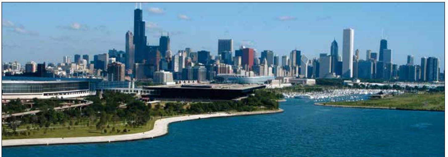
Veduta di Chicago con in primo piano l'enorme centro congressi McCormick Place

L'organizzazione del congresso è stata impeccabile: un continuo servizio di pullman riservati trasportava incessabilmente i 35.000 partecipanti dal centro città alla sede del congresso e viceversa. All'arrivo i partecipanti venivano accolti da un entourage di steward e hostess che li aiutavano ad orientarsi in un posto enorme e altrimenti caotico, rendendo però complessivamente l'esperienza semplice e piacevole. Nonostante l'enorme numero di sale presenti al centro congressi e il programma ricchissimo, il congresso era organizzato in modo che tutti gli argomenti simili si svolgessero in stanze vicine per cui di fatto tutta la