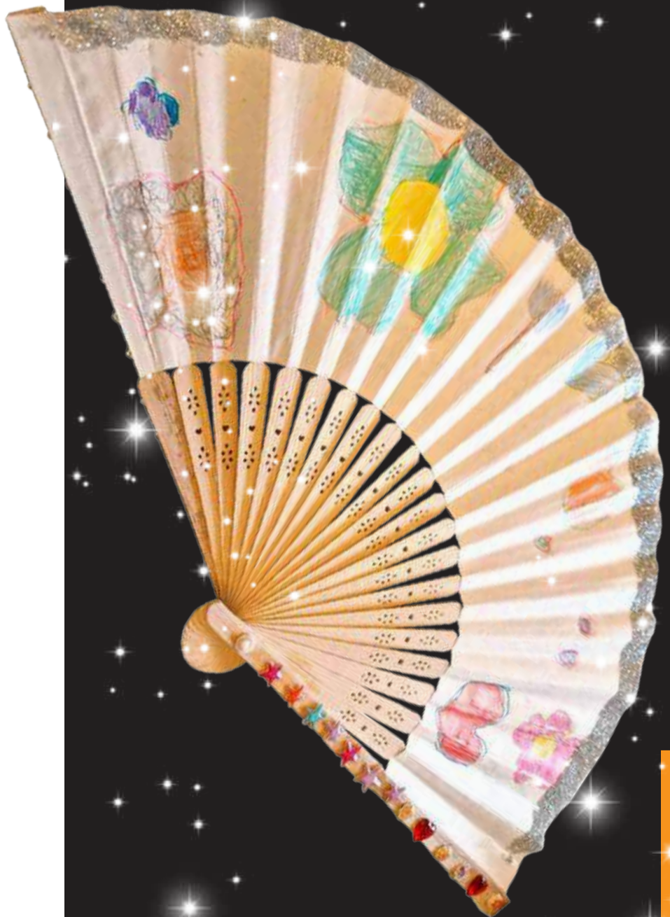
Il ventaglio magico