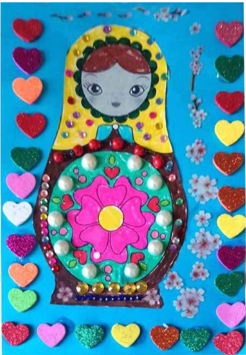
Una matryoska piena d'amore